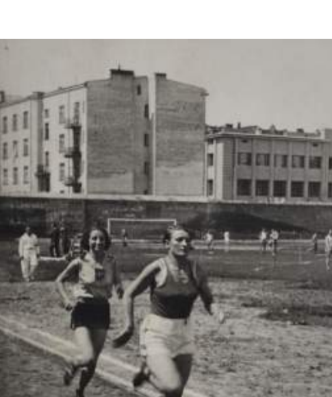
Zawody lekkoatletyczne. Lublin, 1930 r.