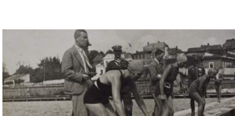
Zawody pływackie na basenie przy ul. Lubomelskiej. Fot. nieznanymi, Lublin, 1934 r.