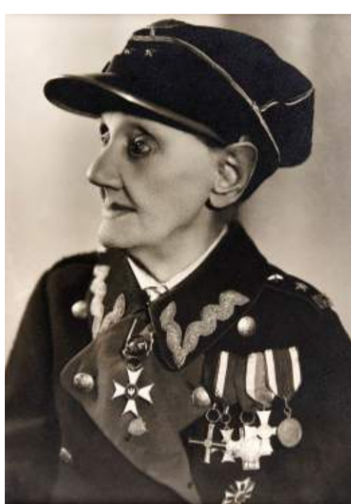
Lucyna ze Skrzyńskich Żukowska (1844–1944) – weteranka powstania styczniowego, uczestniczka bitew pod Zyrzynem, Fajslawicami i Tyszowcami. Fot. Zakład „Bernardi”, E. Funk, Lublin, lata 1929–1939