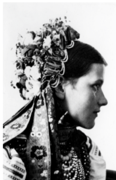
Panna młoda. Krzczonów, powiat Lublin. Fot. Janusz Świeży, 1933 r.