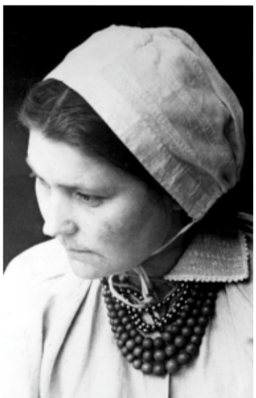
Mężatka w czepku. Wólka Lubartowska, powiat Lubartów. 1952 r.