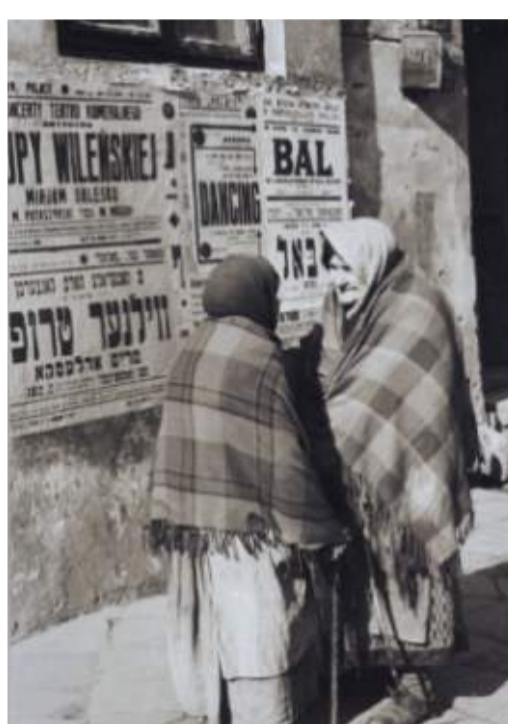
Na ulicy Grodzkiej w Lublinie. Fot. Stanisław Magierski, lata 30. XX w.