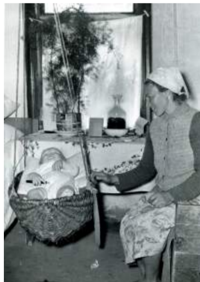
W kolebce. Krasne, powiat Parczew. 1968 r.