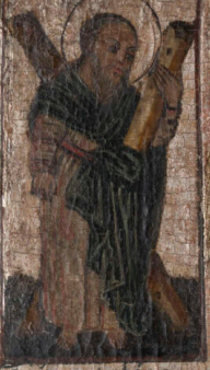
Σ. ΙΑΚΩΒΟΣ Ο ΜΕΙΟΡ