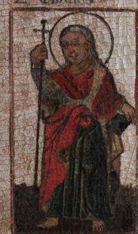
Σ. ΙΩΑΝΝΗΣ Ο ΕΥΑΓΓΕΛΙΣΤΗΣ