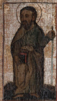
Σ. ΙΑΚΩΒΟΣ ΕΞ ΑΛΦΕΩΝ