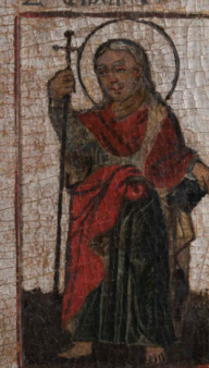
Σ. ΙΩΑΝΝΗΣ ΕΥΑΓΓΕΛΙΣΤΗΣ