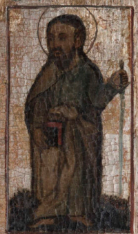
Σ. ΙΑΚΩΒΟΣ Ο ΜΕΓΑΛΟΣ