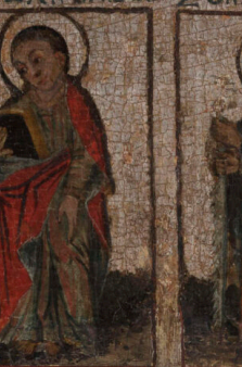
Σ. ΙΩΑΝΝΗΣ Ο ΒΑΠΤΙΣΤΗΣ